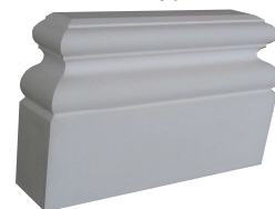
P 13 L 380. H 320. EP 90