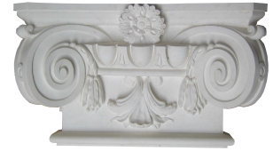
P 23 L 460. H 265. EP 140