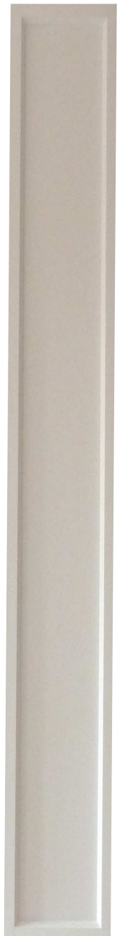
P 4 L 303. H 2.80 EP 50