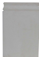
P 11 L 175 H 285 EP 45