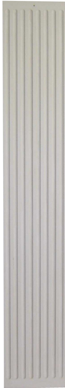
P 2 L 347 H 2230 EP 25